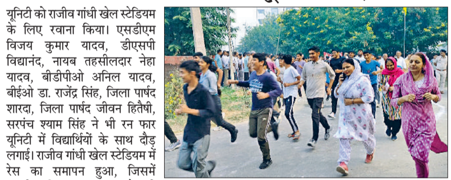
रेवाड़ी। रन फॉर यूनिटी में दौड़ लगाते हुए युवा व महिलाएं।