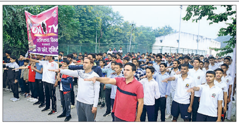
रेवाड़ी। युवाओं व बच्चों को रन फॉर यूनिटी के लिए रवाना करते विधायक लक्ष्मण सिंह व युवाओं को राष्ट्रीय एकता की शपथ दिलाते विधायक व डीसी व स्टेडियम में राष्ट्रीय एकता की शपथ लेते युवा व जिलावासी।