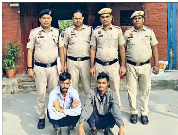
रेवाड़ी। पुलिस गिरफ्तार में बाइक चोरी के आरोपी।