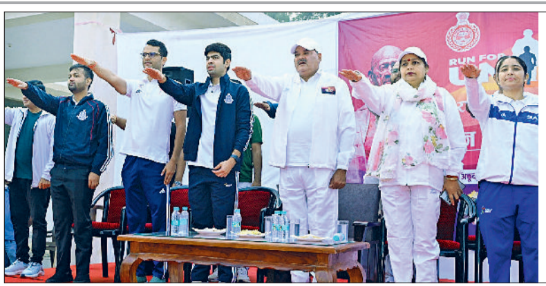
रेवाड़ी। युवाओं व बच्चों को रन फॉर यूनिटी के लिए रवाना करते विधायक लक्ष्मण सिंह व युवाओं को राष्ट्रीय एकता की शपथ दिलाते विधायक व डीसी व स्टेडियम में राष्ट्रीय एकता की शपथ लेते युवा व जिलावासी।