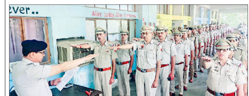
रेवाड़ी। पुलिस कर्मियों को राष्ट्रीय एकता एवं अखंडता की शपथ दिलाते डीएसपी।