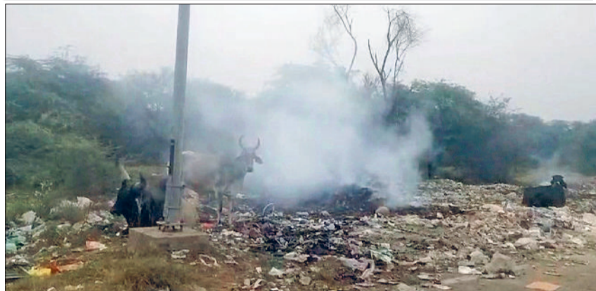
बावल एचएसआईआईडीसी एरिया में कूड़े के ढेर से उड़ते धुआं के गुब्बारे

जहरीली हवा में लोगों का सांस लेना तक दुश्चरा हो रहा है लोगों को आंखों में जलन की शिकायत हो रही है।