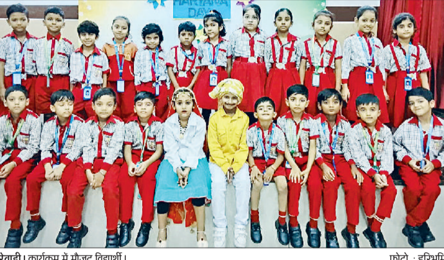
रेवाड़ी। कार्यक्रम में मौजूद विद्यार्थी।