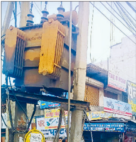
रेवाड़ी। स्कूल बस ने तोड़ा बिजली का पोल, बिजली पोल तोड़ने के बाद खड़ी स्कूल बस।

रवाना हुई थी। बास रोड पर अचानक संतुलन बिगड़ने से बस 11 केवी बिजली लाइन के पोल से टकरा गई। बस पोल से टकराते हुए बिजली आपूर्ति टूट कर गई। बच्चों में चीख-पुकार शुरू हो गई। टक्कर लगने के बाद बस बंद हो गई। आसपास के लोग बच्चों का बचाव करने के लिए बस की ओर लौड़ पड़े। बच्चे बुरी तरह सहम गए। उन्हें दूसरी बस बुलाकर स्कूल भेजा गया, लेकिन बच्चों के चेहरों पर डर साफ झलक रहा था। सूचना मिलने के बाद पुलिस मौके पर पहुंच गई। पुलिस ने बस को कब्जे में लेकर चालक के खिलाफ केस दर्ज कर लिया।