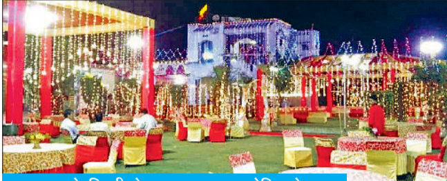
शहर के दिल्ली रोड पर सजाया गया मेरिज होम

इस बार देवउठनी एकादशी 1 नवंबर को प्रातः 9:11 बजे से 2 नवंबर प्रातः 9:31 तक रहेगी