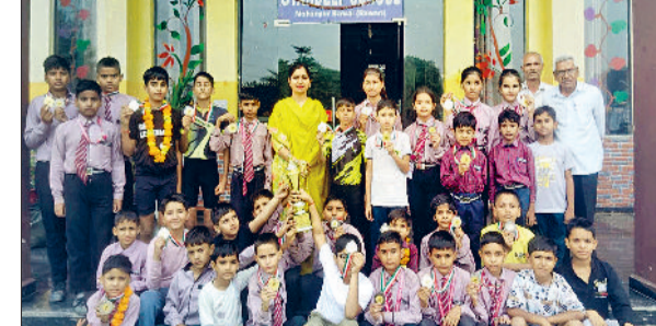
रेवाड़ी। विजेता खिलाड़ी शिक्षकों के साथ।