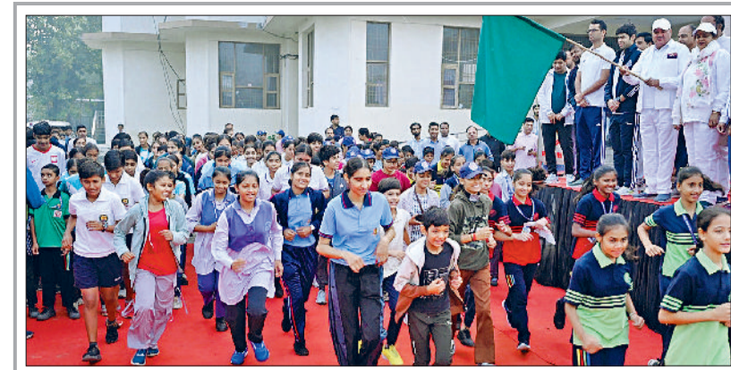
रेवाड़ी। युवाओं व बच्चों को रन फॉर यूनिटी के लिए रवाना करते विधायक लक्ष्मण सिंह व युवाओं को राष्ट्रीय एकता की शपथ दिलाते विधायक व डीसी व स्टेडियम में राष्ट्रीय एकता की शपथ लेते युवा व जिलावासी।